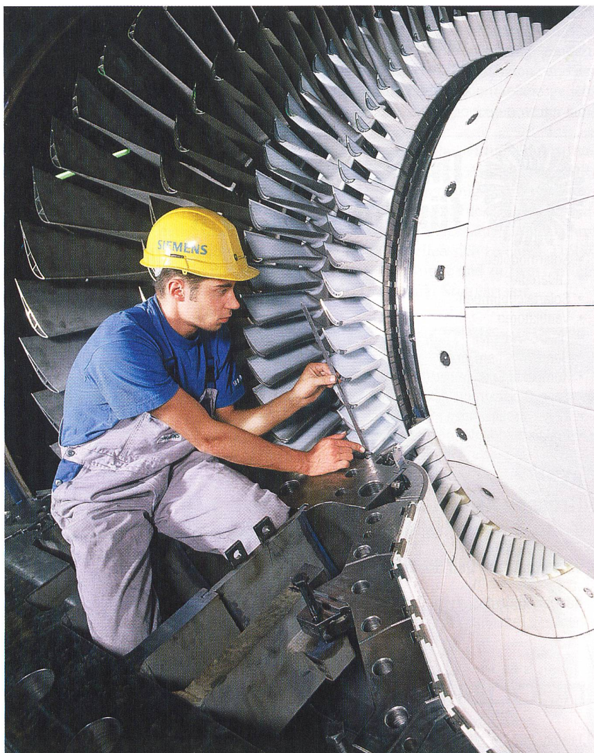
Immer bessere Wirkungsgrade für Gasturbinen.

ken zu nutzen. Angesichts der jüngsten Preisspirale könnte es ausserdem eine Renaissance der Kohle geben», mutmasst Paschereit. «Die Vergasung und schadstoffarme Verbrennung von Kohle ist für solche Grosskraftwerke aber noch technisches Neuland.» Beim Prozess der Kohlevergasung entstehen stark wasserstoffhaltige Brenngase. Sie sind als Ersatz für Erdgas denkbar. «Man könnte den Anteil der Kohlendioxidverbindungen im Gasgemisch vor der Verbrennung abtrennen und in tiefen Tavernen speichern», nennt Paschereit eine Möglichkeit, um die Emissionen von Kohlendioxid bei der Verbrennung von Kohlen gas auf null zu senken.