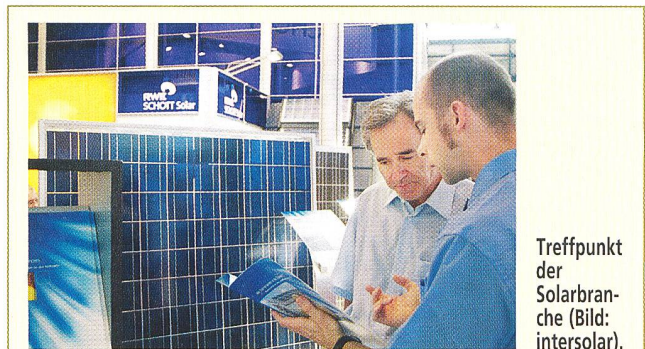
Treffpunkt der Solarbranche.