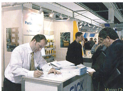
Die Ausstellung am Technology Forum wird ähnlich organisiert wie der Swiss Sensor Market letztes Jahr – der Eintritt ist gratis

Mit dem Technology Forum haben sich Interessensgruppen zusammengeschlossen, die mit der Ineltec und der Go Automation unzufrieden waren und eigene Anlässe organisierten, zum Beispiel die