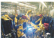
Die Klauen werden über Ethernet gesteuert. Über das OPC-Modell wird die Steuerung...

Industrielle Ethernet-Implementierungen: Die meisten Ethernet-Implementierungen sind nicht industriell geeignet. Sie sind nicht für den Einsatz in industriellen Umgebungen geeignet, sondern sind für den Einsatz in Büroumgebungen geeignet.