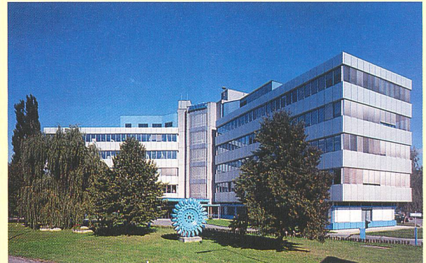
Der Hauptsitz der Andritz AG in Graz, Österreich.

(an) Siemens Österreich und die Andritz AG haben nach Abschluss der finalen Gespräche den Kaufvertrag betreffend die VA TECH Hydro unterzeichnet. Der Kaufpreis für den Erwerb der VA TECH Hydro beträgt zwischen 180 und 190 Millionen Euro. Das Closing der Transaktion ist – nach Vorliegen der Genehmigungen durch die relevanten Kartellbehörden – für Ende Mai 2006 geplant.