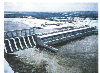
Construction de Bouygues: Barrage de la Baie James/Canada.

ment. Alstom et Bouygues envisagent la création d'une société commune sur le marché des centrales hydroélectriques et ont engagé les études correspondantes. ALSTOM apporterait la totalité de son activité hydroélectrique à la société dans laquelle Bouygues prendrait une participation de 50%.