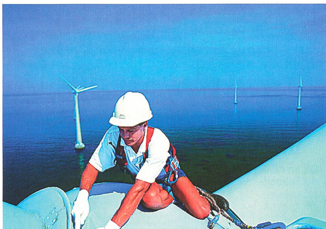
5300 MW Neuinstallationen offshore in den nächsten fünf Jahren.