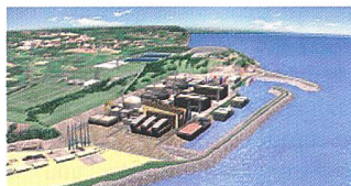
Standort des KKW Flamanville 3 (vorne in der Modellzeichnung) an der Küste der Normandie (Bild EDF).

(zk) Grünes Licht für den Bau eines neuen Kernkraftwerks in der Normandie hat Frankreichs Stromkonzern Electricité de France (EdF) gegeben. Der Europäische Druckwasserreaktor – entwickelt von Areva und Siemens – soll rd. 3,3 Mrd. Euro kosten. Die italienische Enel will sich mit 12,5% beteiligen und erhält im Gegenzug den gleichen Prozentwert an der künftigen Erzeugung. Flamanville 3 soll voraussichtlich bis 2012 ans Netz gehen.