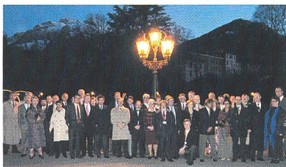
Die Teilnehmer des Cigré Technical Committee Meetings in Interlaken

Die Veranstaltung, mit entsprechendem Rahmenprogramm auch für die Ehegatten, wurde von einigen Schweizer Versorgungsunternehmen und anderen namhaften Firmen gesponsert. Nebst den Arbeitssitzungen des TC wurde das Programm mit einer Besichtigung der Kraftwerksanlagen der KWO in Innertkirchen, einem Gala Dinner sowie einer Exkursion in die Schweizer Brauchtümer wie Folklore, Curling und Raclette bereichert. Am Gala Dinner nahmen nebst