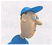
DVD mit Napò: Schluss mit Lärm!