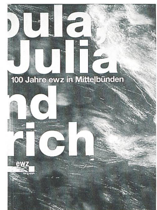
Das Buch zum Jubiläum.

Das rund 150 Seiten umfassende Werk «Albula, Julia und Zürich» wurde von Anna-Rita Stoffel gestaltet und ist mit aktuellen Bildern des Bündner Fotografen Mathias Kunfermann und historischen Aufnahmen aus ewz-Archiven illustriert. Es kann gegen eine Schutzgebühr von Fr. 10.– unter folgender Adresse bestellt werden: ewz, Kraftwerke Mittelbünden, Albulastrasse 167, 7411 Sils i.D., Tel. 058 319 68 68.