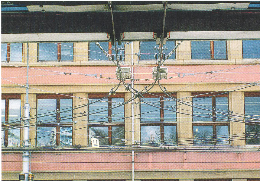
Weichenanzeigen: Liegen gut im Gesichtsfeld des Chauffeurs.