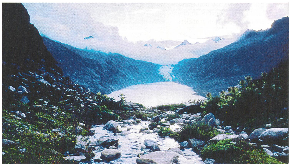
Der Stausee Oberaar (2300 m ü. M.) dient auch als Pumpspeicherbecken.

Für den Besitzer einer bestehenden Pumpspeicheranlage lohnt sich das Pum-