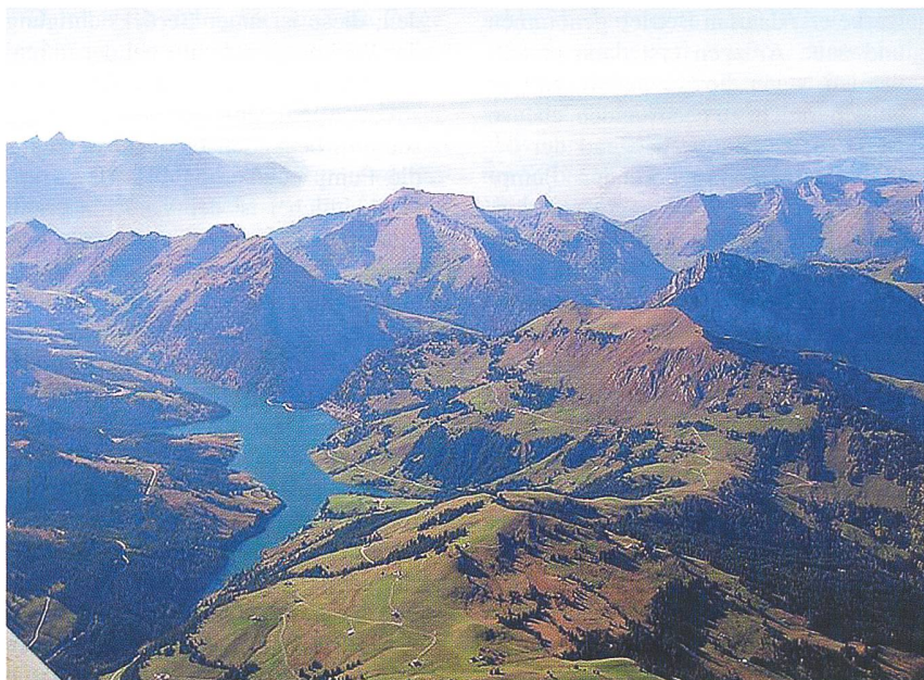
Lac de Hongrin avec le Léman en arrière plan (VD).

Par le biais de l'accumulation par pompage, la part de production d'énergie de pointe d'une installation peut être aug-