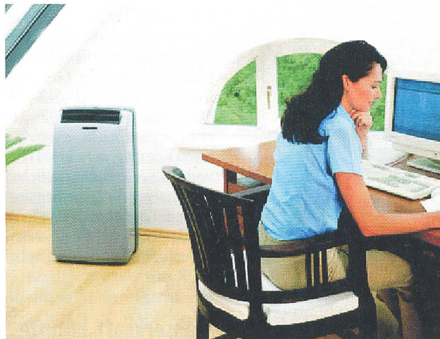
Auch der überdurchschnittlich heisse Sommer in diesem Jahr wird für einen höheren Stromverbrauch sorgen, insbesondere durch den Einsatz von Klimaanlagen.