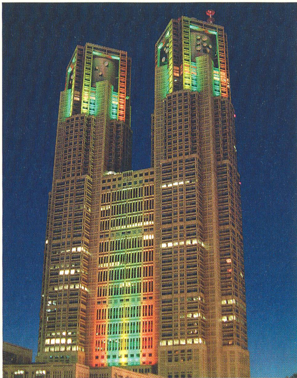
Züge und U-Bahnen fuhren nicht, rund 900 Lifte blieben stecken (Bild Zaimu Metro Tokyo).

(wz) Der Unfall eines Baukrans hat am 14. August in weiten Teilen Tokios den Strom ausfallen lassen. Betroffen waren 1,4 Millionen Haushalte in der japanischen Hauptstadt und der Präfektur Chiba. Züge und U-Bahnen fuhren nicht, rund 900 Lifte blieben stecken. Es war dies der zweitschwerste «Black-out» in der Geschichte Japans. Nach drei Stunden konnte die Stromversorgung wiederhergestellt werden.