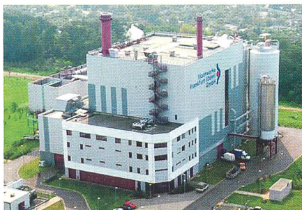
Viele deutsche Stadtwerke planen zurzeit, ein eigenes Kraftwerk zu bauen (Bild Kraftwerk der Stadtwerke Frankfurt/Oder).

Gegenwärtig produzieren laut Studie 11% der Stadtwerke Strom in eigenen Erzeugungsanlagen. Weitere 10% würden gemeinsam mit anderen Elektrizitätsunternehmen ein Kraftwerk betreiben. Drei Viertel der Unternehmen unterhalten dagegen keine eigenen Kraftwerke oder sind an anderen Stromerzeugungsanlagen beteiligt.