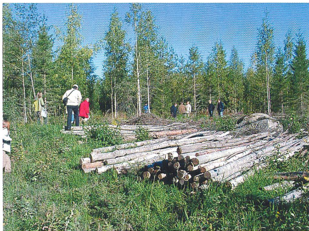
Steigende Preise auch für Energieholz (Bild FH Eberswalde).

Einheimisches Holz als Rohstoff und Energieträger wird in der Schweiz wieder vermehrt