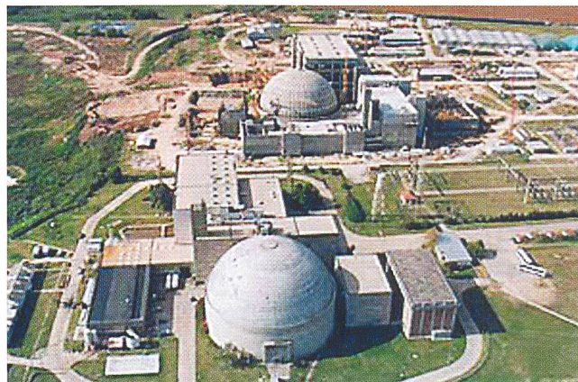
KKW Atucha soll fertiggestellt werden.

(tg) Argentinien will in die Kernkraft investieren und die in den 80er-Jahren eingestellte Anreicherung von Uran wieder aufnehmen. Zunächst würden umgerechnet 450 Mio. Euro für die Fertigstellung des 750-MW-KKW Atucha II bereitgestellt, so Planungsminister De Vido. Zudem werde die Nutzungszeit des KKW Embalse verlängert und die Planungen für den Bau eines vierten KKW mit 1000 MW begonnen. Insgesamt