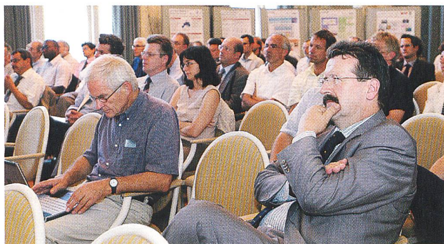
Gezielte Unterstützung von marktauglichen Forschungsprojekten sind den Elektrizitätsunternehmen von swisselectric ein wichtiges Anliegen.

Für Spitzenleistungen, die von hervorragenden Forschern erbracht werden, will «swisselectric-research» ein Zeichen setzen. Sie sollen speziell ausgezeichnet werden – mit dem «swisselectric-research-award». Der Preis, der jährlich vergeben wird, ist mit 25 000 Franken dotiert. Die erste Preisverleihung erfolgt im Sommer 2007. www.swisselectric-research.ch