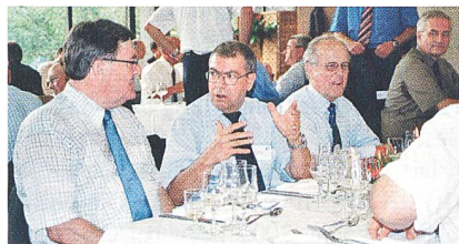
Angeregte Gespräche beim Mittagessen.

bedürfnissen des Landes zu wählen, sondern auch die industrielle Umsetzung zu fördern. «Energieprobleme sind meist auch globale Probleme und verlangen Technologien, die nicht nur national, sondern global zur Lösung einer nachhaltigen, rationellen und sicheren Energieversorgung beitragen», erklärte Kaiser mit Hinweis auf die internationale Verflechtung der Forschung.