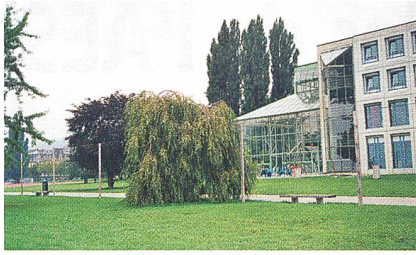
Universität am Neuenburgersee.