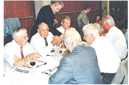
An der VSE-GV kennt man sich.

bedürfnissen des Landes zu wählen, sondern auch die industrielle Umsetzung zu fördern. «Energieprobleme sind meist auch globale Probleme und verlangen Technologien, die nicht nur national, sondern global zur Lösung einer nachhaltigen, rationellen und sicheren Energieversorgung beitragen», erklärte Kaiser mit Hinweis auf die internationale Verflechtung der Forschung.