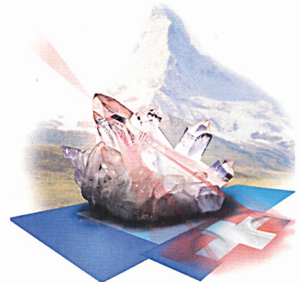
Netzbewertung mit Software von Encontrol

Encontrol GmbH, 5443 Niederrohrdorf, Tel. 056 485 90 44, www.encontrol.ch