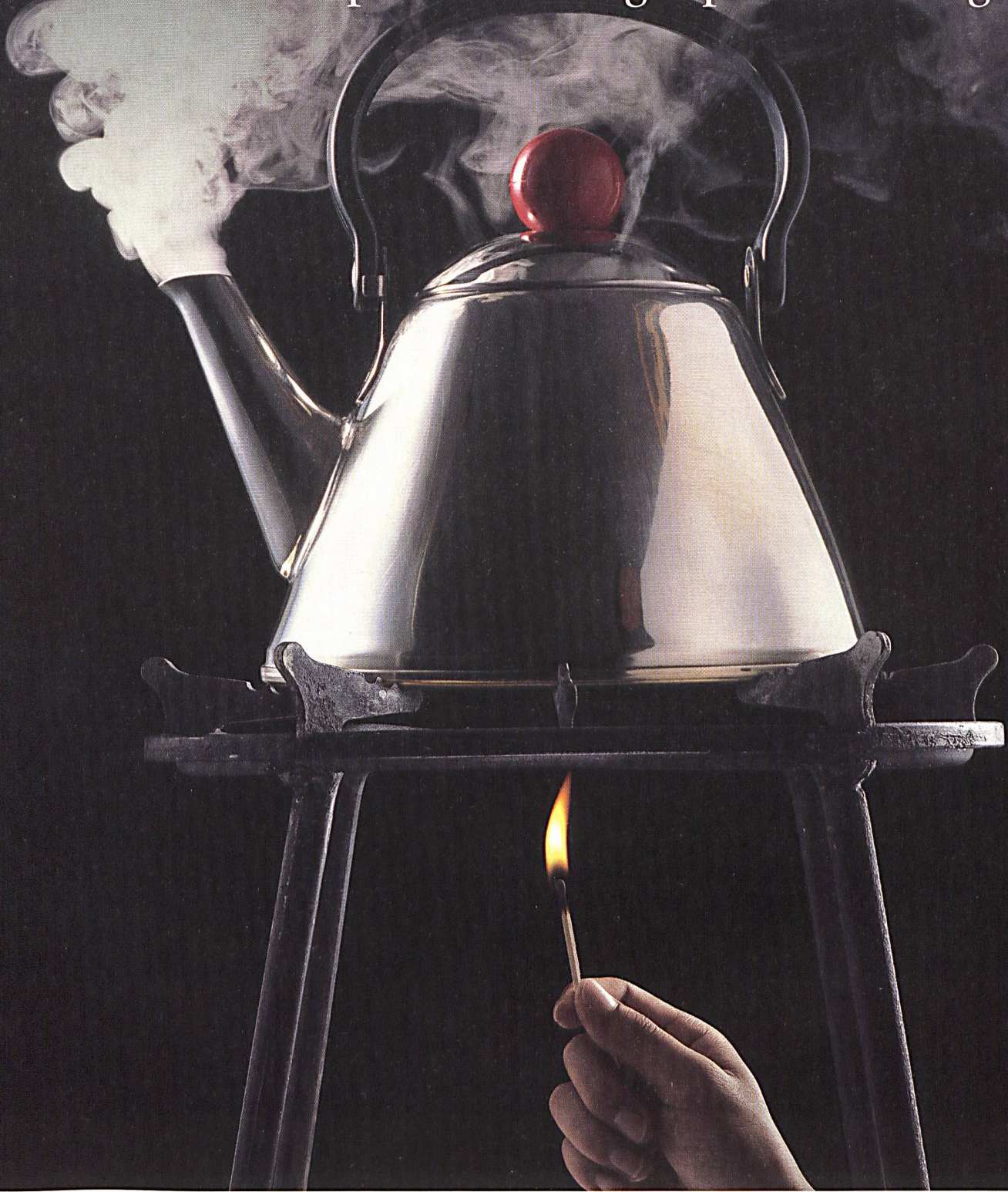
ABB macht Dampf in der Energiespar-Technologie.

Höhere Effizienz im Umgang mit Ressourcen bei gleichzeitiger Produktivitätssteigerung – ABB ist in der Schweiz auf diesem Weg mit weltweit führenden energiesparenden Lösungen dabei. Erfahren Sie mehr über ABB und ihre Energie- und Automatisierungstechnologien unter www.abb.ch