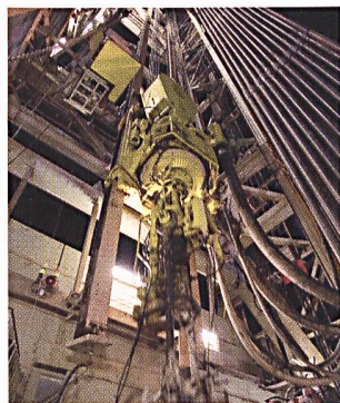
Seit Dezember 2006 ruhen die Anlagen in Basel.

(svg) Die ungenügenden Erfahrungen und wissenschaftlichen Kenntnisse, die nach den erfolgten Erdbeben des Deep Heat Mining Geothermieprojektes in Basel offensichtlich wurden, zeigen, dass ein breit angelegtes Forschungsprogramm zur Stromerzeugung aus heissem Tiefengestein nötig ist. Die bisher kaum erforschte und entwickelte Nutzung