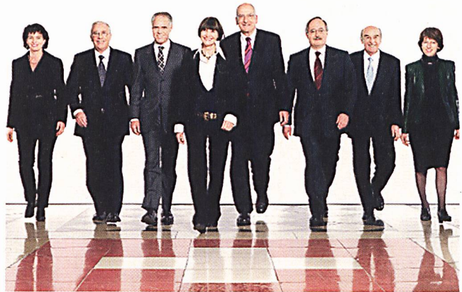
Der Bundesrat beschliesst in corpore eine neue Energiepolitik mit Grosskraftwerken.

Das UVEK erarbeitet bis Ende 2007 Aktionspläne zu Energieeffizienzmassnahmen und zur För-