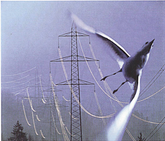
Hohe Volatilität der Strompreise auf dem Markt.

kommt eine breit angelegte Studie von KPMG bei der Unternehmen in Österreich, Deutschland und der Schweiz befragt wurden.