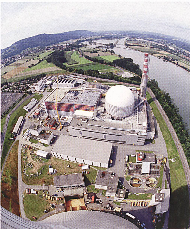
Das Kernkraftwerk Gösgen wurde innert zehn Jahren gebaut.