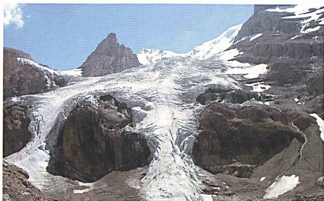
Die Alpengletscher gehen seit 2000 jährlich um einen Meter zurück.