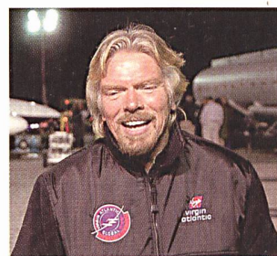
Richard Branson schreibt einen Preis aus zur Entfernung von CO 2 aus der Atmosphäre.

Branson, Vorsitzender der Virgin Gruppe, will die globale Erwärmung damit auch zu einem globalen Thema machen. «Wer in der Lage ist, anhand wissenschaftlicher Beweise zu zeigen, dass grosse Mengen an CO 2 aus der Atmosphäre genommen werden können, soll den Preis erhalten», berichtet Branson. In fünf Jahren soll der Gewinner feststehen, denn so lange läuft die Ausschreibung.