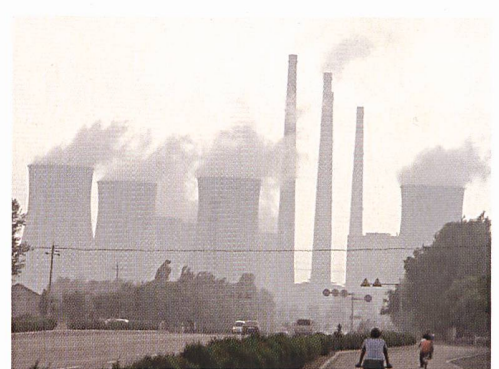
Rasanter CO 2 -Anstieg: Kohlekraftwerk in China.

(iwr) Das anhaltend hohe Wirtschaftswachstum in Ländern wie China und Indien wird nach Einschätzung des Internationalen Wirtschaftsforums Regenerative Energien (IWR) in Münster (D) den weltweiten Ausstoss an Treibhausgasen auch im Jahr 2006 weiter nach oben treiben. Von 2001 bis 2005 ist der globale Ausstoss nach den vorläufigen Angaben des deutschen Bundeswirtschaftsministeriums von 24,9 Mrd. auf 29,2 Mrd. Tonnen CO 2 pro Jahr gestiegen. Während danach in den USA die CO 2 -Emissionen von 6,3 Mrd. (Jahr: 2001) auf 6,5 Mrd. Tonnen (Jahr: 2005) kletterten, ist in China eine Steigerung von 2,8 Mrd. (Jahr: 2001) auf 5,3 Mrd. Tonnen im Jahr 2005 und