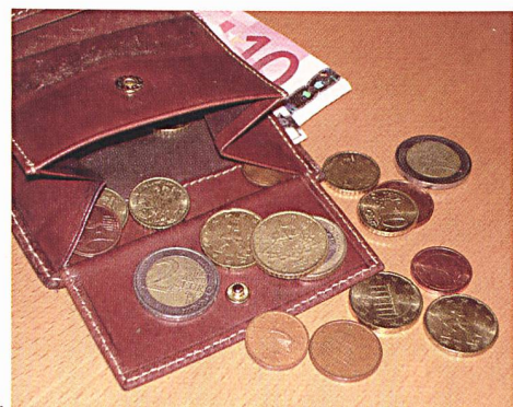
Die Förderung von Ökostrom verursacht Mehrkosten für die Verbraucher.

len sie den Ausbau erneuerbarer Energiequellen wie Wind- und Wasserkraft oder Sonnenwärme bis zum Jahr 2020 auf 20% des Verbrauchs steigern. Insgesamt