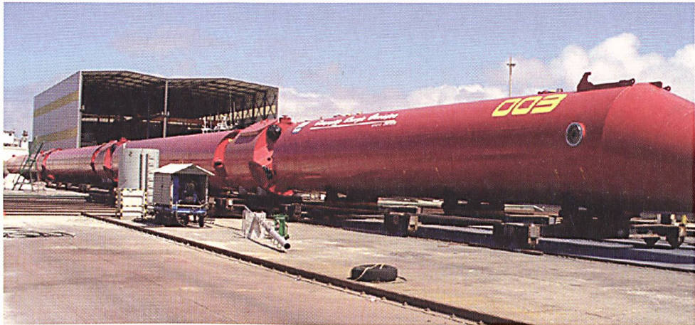
Montage der röhrenförmigen Pelamis-Segmente auf der Werft.

(pteD) Die schottische Regierung hat grünes Licht für die Förderung des weltweit grössten Wellenkraftwerks gegeben. Bereits ab 2008 soll die Anlage