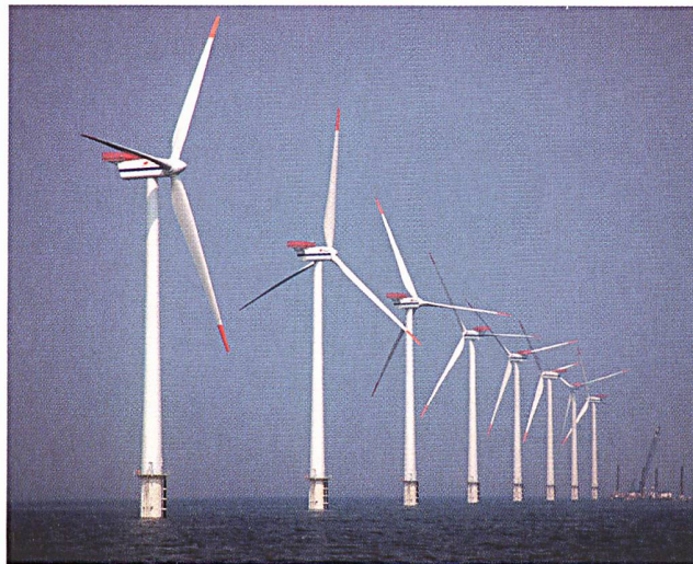
Der grösste Offshore-Windpark der Welt, Horns Rev (160 MW), liegt in der Nordsee, 14 bis 20 km vor der Küste Dänemarks.

(gwec/a) Wie der Global Wind Energy Council (GWEC) nach Auswertung von Daten aus 70 Ländern ermittelte, wuchs die weltweit installierte