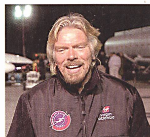
Richard Branson schreibt einen Preis aus zur Entfernung von CO 2 aus der Atmosphäre.

Branson, Vorsitzender der Virgin Gruppe, will die globale Erwärmung damit auch zu einem globalen Thema machen. «Wer in der Lage ist, anhand wissenschaftlicher Beweise zu zeigen, dass grosse Mengen an CO 2 aus der Atmosphäre genommen werden können, soll den Preis erhalten», berichtet Branson. In fünf Jahren soll der Gewinner feststehen, denn so lange läuft die Ausschreibung.