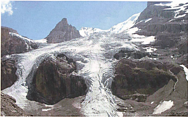
Die Alpengletscher gehen seit 2000 jährlich um einen Meter zurück.