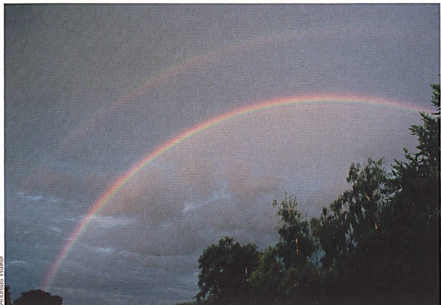
Bild 1 Lichtbrechung erzeugt zwei Regenbogen.

So faszinierend der Regenbogen auf viele Menschen wirkt, so war er früher auch mit viel Aberglauben verbunden. Oft betrachtete man den Regenbogen als schlechtes Vorzeichen. Man sagte ihm nach, er ziehe an seinen Enden alles nach oben, auch Wasser, samt Fischen, für neue Gewitter. Der zweite schwächere Sekundärregenbogen mit umgekehrter Farbabfolge galt als teuflische Nachahmung des inneren Bogens, und unvollständige Re-