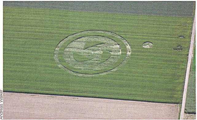
Kornkreis in Ettiswil (LU).

häufigsten treten Kornkreise in Südengland auf. Jeden Sommer entstehen neue Gebilde – immer grösser, immer komplexer und immer komplizierter. Sollten diese Kornkreise von Menschenhand gemacht worden sein, fehlt bis heute eine plausible Erklärung, welche Methode genau angewendet wurde. Erstaunlich ist, dass die Halme des Kornes manchmal in verschiedenen konzentrischen Kreisen umgelegt sind, wobei sie die Richtung jeweils abrupt wechseln – vom Uhrzeigersinn zum Gegenuhrzeigersinn und umgekehrt. So etwas über Nacht in so exakter Form herzustellen, ohne das ganze Kornfeld zu zertrampeln, ist eine reife Leistung. Merkwürdig auch, dass noch nie jemand in flagranti dabei ertappt wurde. Während einige an einen faulen Zauber glauben, der von Menschenhand gemacht wurde, neigen die anderen dazu, den Ursprung dieser Gebilde den Ausserirdischen zuzuschreiben. In beiden Fällen fehlt jedoch eine exakte Erklärung. (Andreas Walker/Sz)