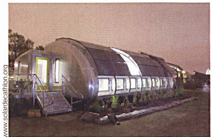
Futuristisches Solarhaus der University of Michigan.