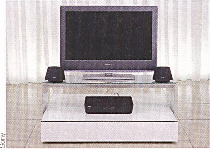
Sony-BRAVIA-LCD-Fernseher verbrauchen weniger als 1 Watt im Standby-Modus.

Sonys Bemühungen sind nicht unbezahlt geblieben: Im Februar 2007 hat Sony als erstes Unternehmen der Unterhaltungs-