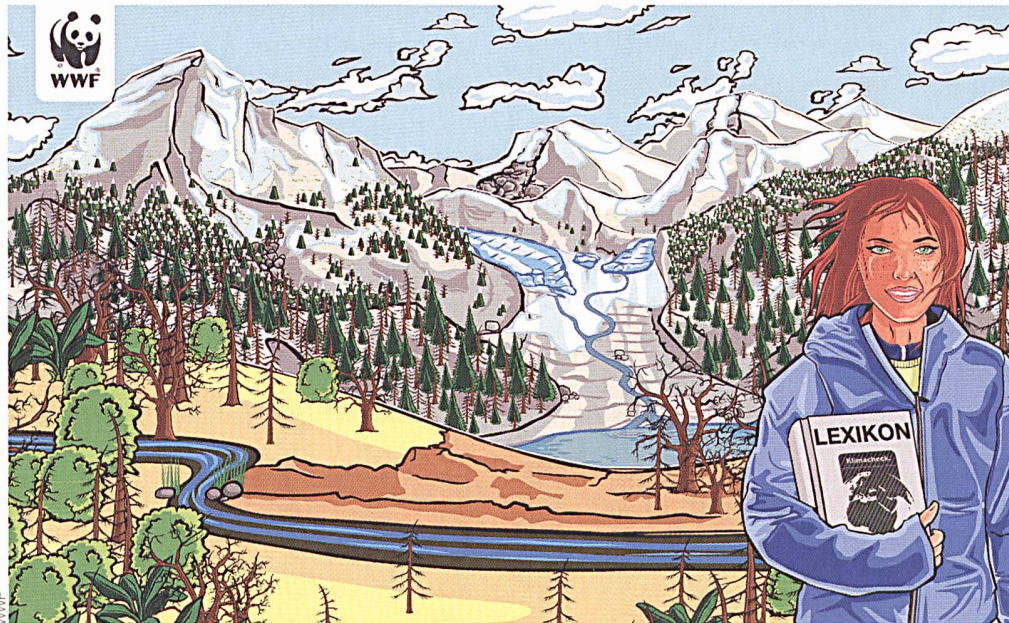
Im Lauf des Spiels verändert sich das Landschaftsbild.

bekannt geben – und sieht auf einer Schweizer Karte, wie viele Commitments schon abgegeben wurden und wie «sein» Kanton im Vergleich mit anderen steht. ( wwf.ch )