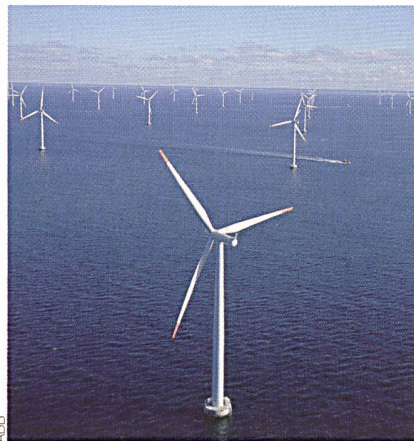
Ein Windpark mit 400 MW Leistung entsteht in der Nordsee – im September 2009 soll der erste Strom fließen.

In der Nordsee wird ein Windpark mit einer Leistung von 400 MW entstehen. ABB erhielt vom deutschen Energiekonzern E.ON einen Auftrag über 400 Millionen US-Dollar für die Lieferung der Strominfrastruktur, die den Offshore-Windpark an das deutsche Stromnetz anbinden wird. 9 Millionen davon fließen nach Lenzburg, wo ABB die Leistungshalbleiter produziert.