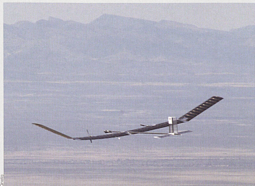
Zephyr erreichte eine Höhe von 18000 m.

zeugcockpits. Von hier aus wird das Flugzeug in seine Position gebracht», erklärt Chris Kelleher, Pilot und technischer Direktor von Zephyr. Bei seinem Testflug erreichte der Flieger eine Höhe von 18000 m. (Qinetiq/gus)