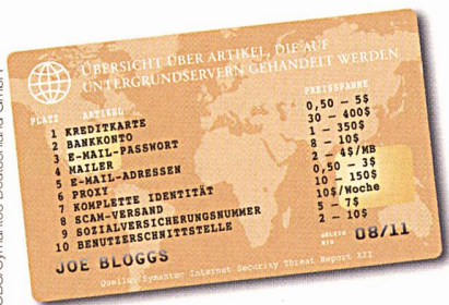
Gestohlene Kontodaten und persönliche Informationen werden auf Untergrundservern für wenige Dollar angeboten.

ein neuer, gemeinsamer Industriestandard und diesen als internationalen Standard anerkennen zu lassen. Die Länder, die innerhalb Cenelec aktiv sind, schlugen Ende 2004 die europäische Norm EN 50090 zur internationalen Standardisierung durch ISO/IEC vor. Im November 2006 wurde das