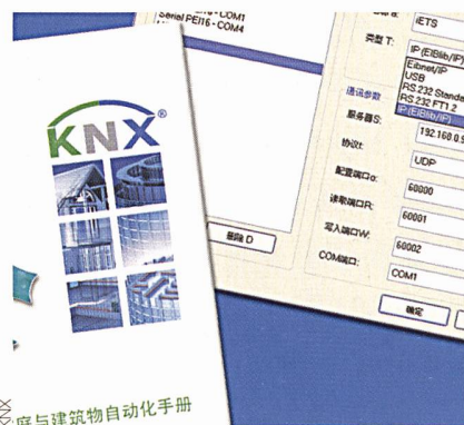
KNX spricht Chinesisch.

In den frühen 90er-Jahren entstanden mit EIB, EHS und Batibus die Vorgänger von KNX. Im Jahr 1997 schlossen sich die drei Organisationen zusammen, um gemeinsam den Markt für intelligente Gebäudesystemtechnik zu entwickeln. Ziel war