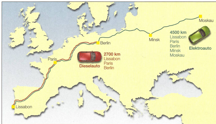
Bild 2 Effizienzvorteile des Elektroantriebs: Weiter fahren mit weniger Energie. Distanz, die mit einem Barrel Rohöl zurückgelegt werden kann.

bei einer direkten Verbrennung im Fahrzeug. Eine bei stationären Kraftwerken mögliche Abwärmenutzung würde den Effizienzvorteil weiter erhöhen.