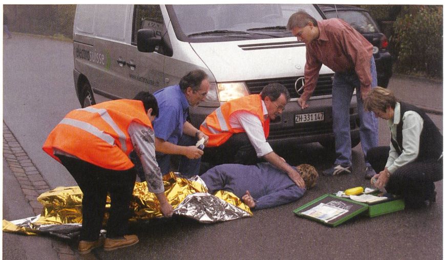
Schnelles Handeln rettet Leben!

Wer also noch nie einen Nothilfekurs gemacht hat, sollte das schleunigst nachholen. Zu wissen, wie man seinen Mitmenschen und insbesondere auch seinen Nächsten in unglücklichen Situationen hilft, das beruhigt nicht nur, sondern kann auch wirklich Leben retten! (Petra Winterhalter)