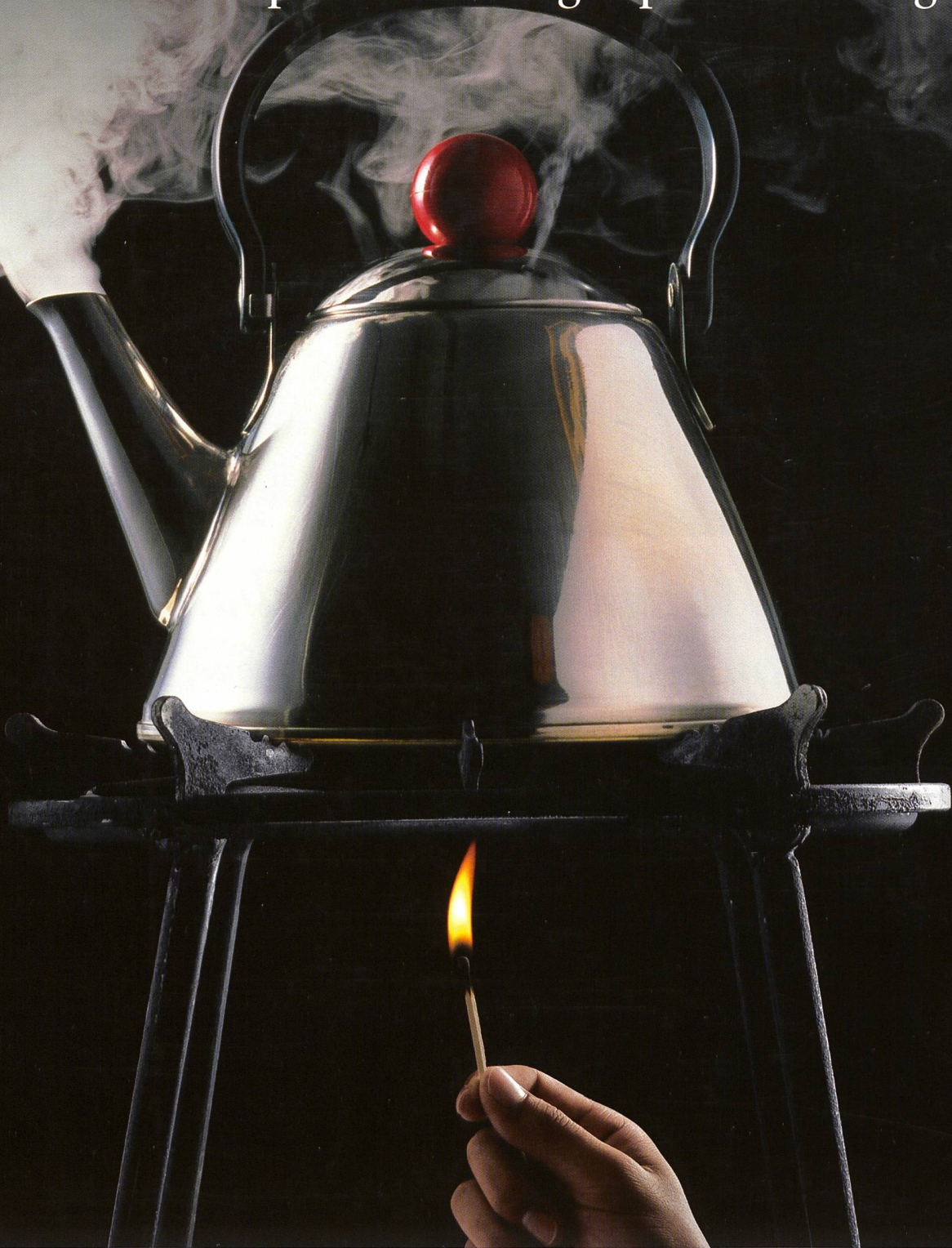
ABB macht Dampf in der Energiespar-Technologie.

Höhere Effizienz im Umgang mit Ressourcen bei gleichzeitiger Produktivitätssteigerung – ABB ist in der Schweiz auf diesem Weg mit weltweit führenden energiesparenden Lösungen dabei. Erfahren Sie mehr über ABB und ihre Energie- und Automatisierungstechnologien unter www.abb.ch