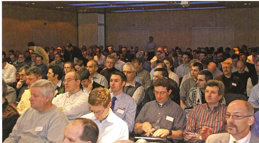
Gut besuchte Erdungstagung der ETG. – Journée de l'ETG bien fréquentée sur la mise à la terre.

Ein Schwerpunkt der Tagung war der Korrosion gewidmet. Denn obwohl die Stähle immer besser beschichtet werden, gibt es immer wieder Fälle von starker Korrosion. Dies liegt oft daran, dass Wasserrohre oder Druckleitungen und Schütze bei