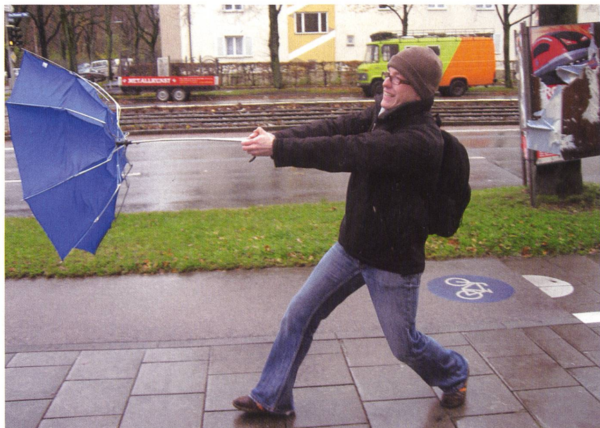
Je wärmer das Klima wird, desto stärker werden die Regengüsse.

Beobachtungsdaten verglichen die Forscher mit detaillierten Modellrechnungen zum vergangenen und künftigen Klima. (Prophysik/gus)