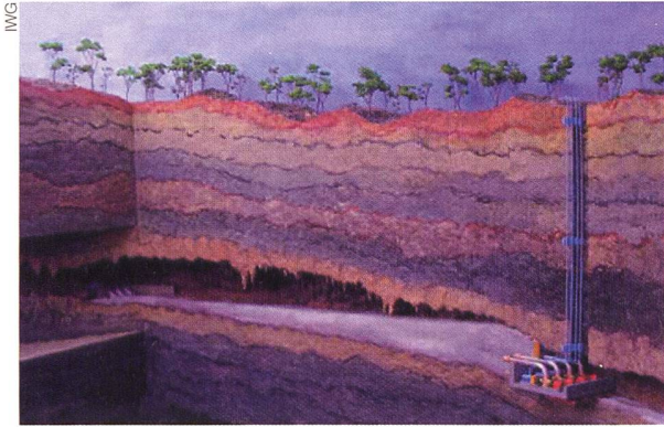
Wasser aus der Höhle: Das Kraftwerk liegt 100 m unter der Erdoberfläche

versickert rasch, sammelt sich aber in einem unterirdischen Höhlensystem. Über 1000 l/s fließen beispielsweise selbst in der Trockenzeit durch die Höhle Bribin. Hier bauten die Wissenschaftler das Stauwerk. Der Wasserdruck treibt Turbinen an, die über ein Getriebe mit Förderpumpen gekoppelt sind. Sie drücken einen Teil des Wassers 200 m hoch in einen Speicher.