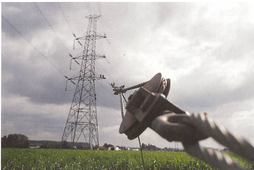
Interconnexion France-Belgique: Déroulage de câble sur la ligne 400 000 V Avelin-Avelghem (Nord).

Andris Piebalgs, le commissaire européen à l'Énergie, a salué cette initiative. Selon lui, cet accord est un exemple impor-