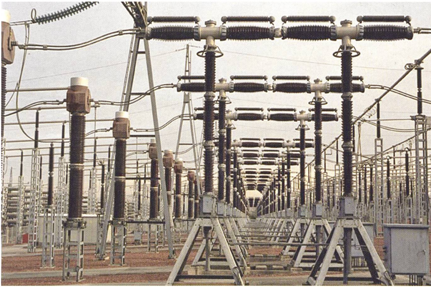
RTE's Media / Sauveur David