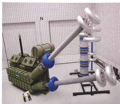
Der 800-kV-Stromrichtertransformator beim Test im Labor.

Nach der erfolgreich verlaufenen Endabnahme im Siemens-Transformatorwerk in Nürnberg steht der erste 800-kV-Transformator für Hochspannungs-Gleichstrom-Übertragungsanlagen (HGÜ) zur Auslieferung bereit. Zum Einsatz kommt er in der HGÜ-Anlage Yunnan-Guangdong in China, eine der beiden leistungsstärksten HGÜ-Anlagen der Welt. Siemens liefert für diese Anlage 10 der 800-kV-HGÜ-Transformatoren sowie weitere 10 Einheiten mit einer Gleichstromisoliervoltage von 600 kV. Die HGÜ-Anlage wird von Mitte 2010 an eine Leistung von 5000 MW über 1400 km zwischen der Provinz Yunnan im Südwesten Chinas und der im