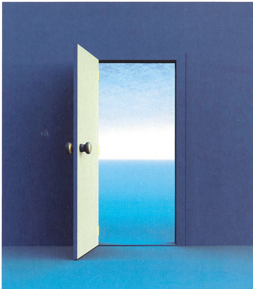
La situation de marché modifiée exige une nouvelle stratégie.

Par ailleurs, puisque le marché suisse de l'électricité prépare son ouverture, de nombreux acteurs énergétiques tant publics que privés (collectivités publiques, sociétés de distribution, etc.) se sont regroupés et vont continuer à regrouper leurs compétences et leurs ressources en établissant deux différents types de coopération, soit: