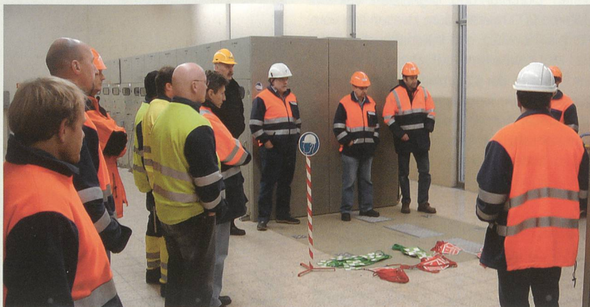
Der VSE bietet neue Ausbildungsveranstaltungen im Bereich Netzbetrieb und Instandhaltung an.

Verteilnetzes selbstständig aus. Weiter sind die Teilnehmer in der Lage, die Arbeitsstellen gemäss Vorschriften zu sichern. Im praktischen Teil werden Manipulationen und die elektrische Absicherung an den gängigen Netzschaltelementen geübt und gefestigt. Neben den bereits bewährten Kursen «Kontrolle öffentlicher Beleuchtungsanlagen», «Messen und Störungssuche», «Erdungsmessungen in elektrischen Verteilnetzen» führt der VSE auch dieses Jahr die Fachausbildung für Mitarbeiter in Kraftwerken, Unterwerken und Netzbetrieb weiter. Weitere Infos und Anmeldung: www.strom.ch (VSE/bs)