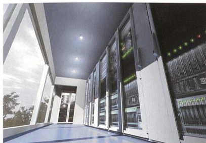
Komplettlösungen von Rittal für energieeffiziente, sichere und hochverfügbare IT-Infrastrukturen.

Neben den Servern sind die grössten Stromfresser im Rechenzentrum bei der Klimatisierung und in der Stromversorgung zu suchen. Auf effiziente neue Systeme umzuschalten, ist in diesen Bereichen deshalb besonders sinnvoll. Rittal bietet Lösungen, die dafür sorgen, dass mit der Infrastruktur Energie gespart werden kann.