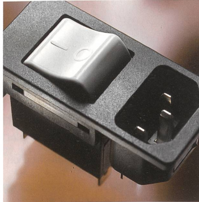
Klein und kompakt: Gerätestecker und Schutzschalter vereint im Kombielement 6135 von Schurter.

Das neue Gerätestecker-Kombielement Typ 6135 von Schurter vereint Gerätestecker und Geräteschutzschalter in einer Komponente. Die Serie bietet einen einfachen und kostengünstigen Überstromschutz, vor allem in Anwendungen mit Motoren. Der Gerätestecker nach IEC 60320/C14 ist mit dem Geräteschutzschalter TA35 in einem Gehäuse integriert, geeignet für