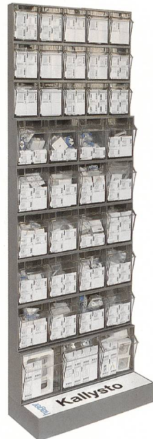
La Kallysto Stock Box de Hager réunit dans un espace restreint les articles et les pièces de rechange Kallysto.

Dans ce but, Hager a développé la Kallysto Stock Box. Grâce à ce système, les pièces de rechange et les appareils pour combinaison les plus cou-