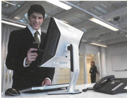
Téléphonie plus efficace et diversifiée grâce aux nouvelles fonctions des systèmes Ascotel IntelliGate.

GSM dans le réseau de communication de l'entreprise,