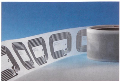
Die Herstellverfahren für RFID-Antennen in gedruckter Form ermöglichen effizientere Produktionsprozesse.

Organische Halbleitermaterialien sind eine vielversprechende Materialklasse für viele Anwendungen wie OLED-Bildschirme, Raumbeleuchtung, Solarzellen, elektroni-