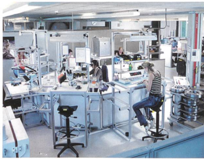
«ITG vor Ort» ist eine neue Art von Veranstaltung, bei der man in die Firmen reinschauen kann.

Der erste Anlass der neuen Plattform «ITG vor Ort» findet in Frauenfeld bei Bau-