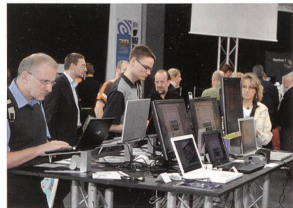
Nicht mehr ganz so gross wie um die Jahrtausendwende, hat sich die Orbit dennoch als Treffpunkt für die ICT-Branche etabliert.

Die Orbit ist die Visitenkarte der Schweizer ICT-Branche und wird deshalb von vielen wichtigen Verbänden unterstützt, vor allem von ICT Switzerland, dem Dachverband sämtlicher Verbände und Organisa-