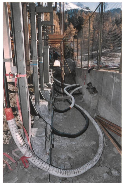
Hohe Belastbarkeit in anspruchsvoller Umgebung: Kabelschutzrohre von Symalit AG.

Die Produktpalette umfasst Noflam- und Chiaro-Kabelschutzrohre, Mehrfachrohre, flexible Kabelschutzrohre und Kabelschutzrohrbogen, Längverschluss-Kabelschutzrohre und -Bogen, DIL-Force-Kabel-