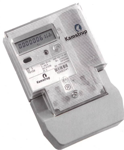
Zähler von Kamstrup: mit einem Eigenenergieverbrauch von nur 0,6 W macht er einen Unterschied.

Das modulare Prinzip bietet die Möglichkeit, gleichzeitig Daten zu lesen, Zähler zu verwalten und Heimautomatisierungen mit ein und demselben Stromzähler auszuführen. Der Zähler kann Verbrauchsdaten in einem internen drahtlosen Netzwerk übertragen. Zusätzlich hat der energiebewusste Kunde einen einfachen Zugriff auf die ge-