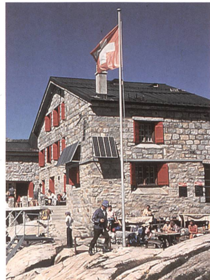
Stromversorgung einer SAC-Hütte mit Modulen von Sumatrix.

Als Engros-Lieferant für Produkte der Solarbranche hat sich die Firma Sumatrix AG (vormals Neogard AG) einen ausgezeichneten Namen geschaffen. Im Verlaufe der vergangenen Jahre konnte die Firma einen beachtlichen Kundenstamm aufbauen.