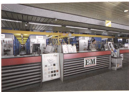
Jede der Niederlassungen von EM besitzt einen leistungsstarken Shop.

Die Elektro-Material AG als Grosshandelsunternehmen der Elektroinstallationsbranche bearbeitet mit 500 Mitarbeitenden und 8 Niederlassungen im Jahr rund 1,5 Mio. Aufträge für 10000 Kunden. Als starker Partner sichert EM die Produktverfügbarkeit und den Wissenstransfer zwischen den Herstellern und dem Fachhandel.