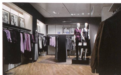
Ladenbeleuchtung von RD Leuchten AG.

RD Leuchten AG, Hersteller von Beleuchtungskörper für Ladenbeleuchtung mit Sitz in Bad Zurzach (Schweiz), hat ein LED-System für die Ladenbeleuchtung entwickelt, das die Qualitätsmerkmale der besten herkömmlichen Beleuchtungen in einem einzigen System vereinigt und eine bisher ungekannte Lichtqualität ermöglicht. Manor, die grösste Warenhauskette der Schweiz, setzt das neue System von RD Leuchten bereits erfolgreich ein. Damit hat