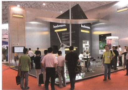
Der Stand von Bachmann Electronic an der Wind Power Asia in Peking.

Das international tätige Hightech-Automatisierungsunternehmen Bachmann Electronic begeisterte an der Wind Power Asia in Peking, China, einer bedeutenden Windmesse, mit Ausstellungsschwerpunkten wie Safety Control, Matlab/Simulink und Condition Monitoring die Besucher. Mit einer sehr guten Besucherresonanz und den fortschrittlichen und qualitativ hoch-