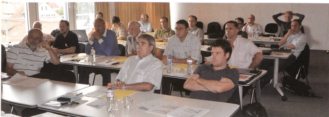
Konzentriertes Zuhören beim Workshop.