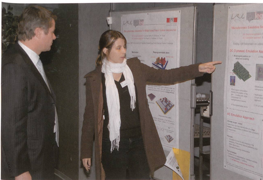
In der Poster Session mit 11 Ausstellern liessen sich spezielle Themen vertiefen. La Poster Session avec 11 exposants a permis d'approfondir des sujets particuliers.