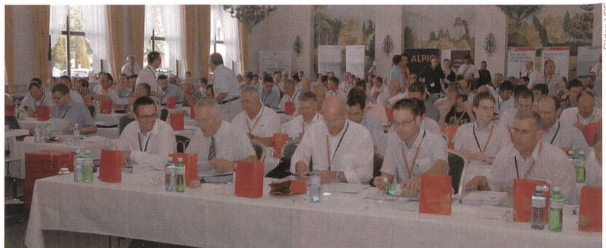
Rund 180 Teilnehmer besuchten die 6. Betriebsleitertagung des VSE in Brunnen.

Neben dieser geballten Ladung an Information und Diskussionen kam aber auch die Geselligkeit nicht zu kurz. So zum Beispiel auf der Schifffahrt am Ende des ersten Tages, wo sich die Teilnehmer bei Postkartenwetter und einem Glas Wein austauschen konnten und Gelegenheit hatten, in idyllischer Umgebung neue Kontakte zu knüpfen. (es)