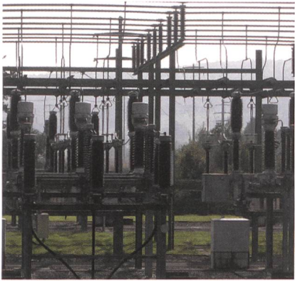
Als kritische Infrastrukturen werden Einrichtungen personeller, materieller und institutioneller Art verstanden, welche das Funktionieren einer Gesellschaft garantieren. Im Bild: Unterstation Buchs.