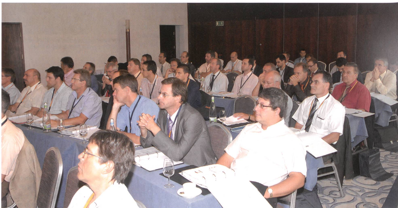
Les 90 directeurs et cadres présents à Neuchâtel ont apprécié la diversité et la profondeur des exposés.

pack, Dynamo, Landis + Gyr et Yutility. Le responsable du bureau romand de l'AES a dans la foulée relevé le haut niveau des débats de ces Journées 2009. Il a aussi remercié le public de sa participation active aux discussions. Dans l'idée de poursuivre cette formule gagnante l'an prochain, il a d'ores et déjà donné rendez-vous les 2 et 3 septembre prochains pour les Journées 2010. (Ng)