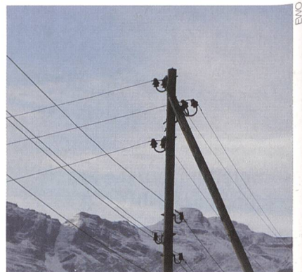
Mittelspannungs-Verteilnetz des EW Obwalden

Traditionell veranstaltet das schweizerische Nationalkomitee Cigré/Cired im Herbst einen Informationsnachmittag aus den Themenbereichen des Jahreskongresses.