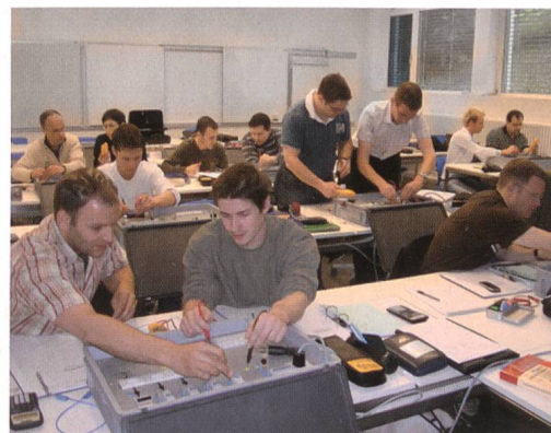
Vorbereitungskurs im Mai 2008.

ABB-Technikerschule, 5400 Baden, Tel. 058 585 46 67, p.bosshart@abpts.ch . (Peter Bosshard/No)