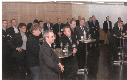
Konzentrierte Zuhörer beim Energie-Lunch.

Der Energie-Lunch findet über Mittag statt und dient in erster Linie dem Networking. Ein kurzer Vortrag von den Elektrizitätswerken des Kantons Zürich (EKZ) unterbricht den Stehlunch und zeigt, wie aus