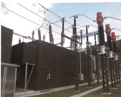
Phasenschiebertrafo im Umspannwerk Tauern.

Unter dem Titel «Neue Isolierflüssigkeiten auf Basis pflanzlicher, biologisch abbaubarer Öle» schliesslich wird dargelegt, wie