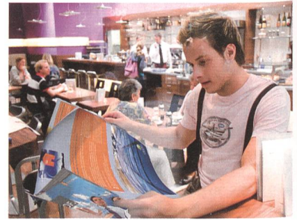
Angenehme Lektüre: das Kundenmagazin «OF Punkt» von Otto Fischer.

Das Magazin widmet sich jeweils einem interessanten Thema, wie Solarstrom oder Gebäudeautomation, das übersichtlich auf den Punkt gebracht wird.