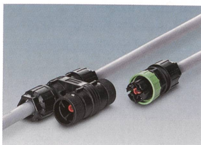
Quickon Steckverbinder von Phoenix Contact.

Quickon-Power-Distribution ist eine industrietaugliche Installationstechnik in Schutzart IP 68 und einer Hammerschlagfestigkeit gemäss IK 07. Durch den Verzicht auf das Vorbehandeln der Leiter lassen sich bis 80% Installationszeit einsparen. Die 4-polige IDC-Schnellanschlussstechnik ist für 690 V und 20 A spezifiziert und kann Leiter von 1,0–2,5 mm 2 aufnehmen. Die festen und steckbaren Quickon-Anschlüsse