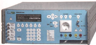
Immunitäts-Prüfgerätesystem TRA3000 von EMC Partner.

Messungen von Temperatur, Feuchtigkeit und Luftdruck sind möglich und können in das HTML-Prüfprotokoll integriert werden. Ein USB-Stick wird verwendet für das sichere Kopieren von Prüf- und Service-Dateien auf andere Geräte. Das TRA3000 wurde für die Zukunft entwickelt.