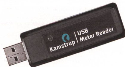
Passt in jede Hemdtasche: USB-Meter-Reader von Kamstrup.

Der USB-Meter-Reader von Kamstrup ist, wie der Name vermuten lässt, ein kleiner USB-Stick, der einschliesslich Stromversorgung problemlos in jede Hemdtasche passt. Sobald er in physische Nähe eines mit Funkmodul ausgerüsteten Verbrauchszählers kommt, identifiziert er automatisch und drahtlos den Zähler. Wird die Identifikationsnummer des Zählers erkannt, werden sämtliche notwendigen Verbrauchsdaten ausgelesen.