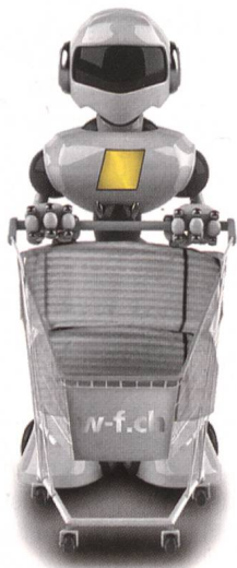
Einkaufen im neuen Webshop von Winterhalter+Fenner.

Die virtuelle Filiale von Winterhalter + Fenner ist eröffnet. Dank frischem Design und neuartigen Funktionen erledigen Kunden ihre täglichen Einkäufe noch speditiver. Mit der einfachen Suche nach allen erdenklichen Auswahlkriterien findet jeder Benutzer in Rekordzeit seine gewünschten Produkte aus dem 200 000 Artikel starken Sortiment. Warenkörbe, Kostenstellen und Lieferadressen können mit einem Klick mehrfach angelegt werden. Und damit garantiert nie-