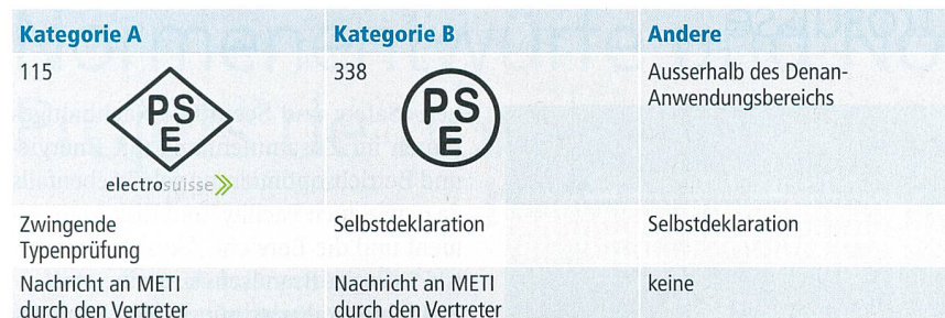
Tabelle Geräte kategorien gemäss Denan.

Das japanische Gesetz für die Sicherheit von elektrischen Geräten und Materialien gibt es seit 1961. Damals hiess es Dentori (Electrical Appliance and Material Control Law). Es wurde dann im Jahre 2001 auf Denan-Gesetz (Electrical Appliance and Material Safety Law) umbenannt, und gleichzeitig wurde auch das PSE-Zeichen eingeführt. PSE steht für Product Safety Electrical.