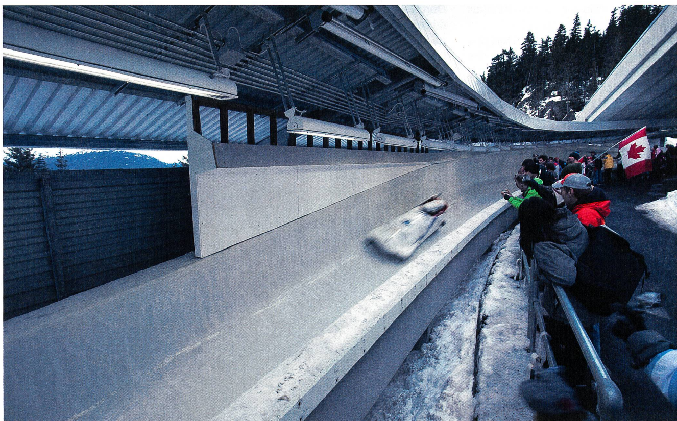
Bobbahn in Whistler: «Besser wäre es, die Winterspiele stets an demselben Ort auszutragen.»