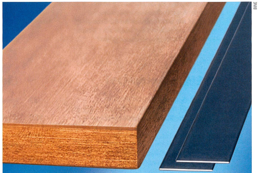
Neuer Supraleiter (rechts) leitet verlustfrei die gleiche Stromstärke (200 A) wie das Cu-Band (links).

BINE Informationsdienst ist ein Service von FIZ Karlsruhe und wird vom Bundesministerium für Wirtschaft und Technologie (BMWi) gefördert. FIZ Karlsruhe ist Dienstleister und Servicepartner für das Informationsmanagement und den Wissenstransfer in Wissenschaft und Wirtschaft sowie Entwicklung von E-Science-Lösungen. CKe