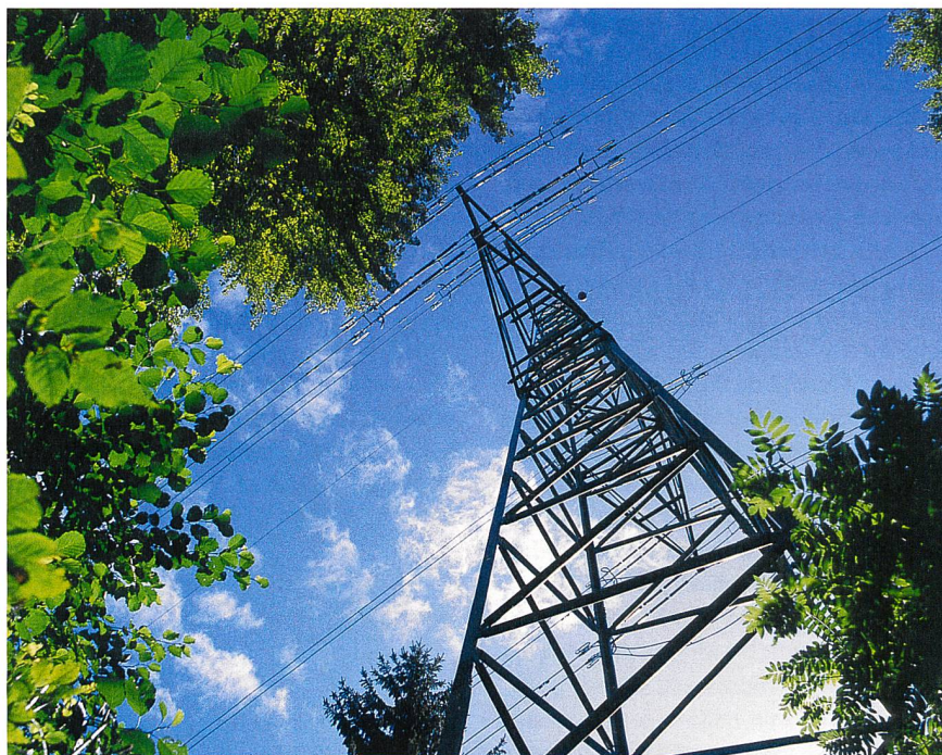
Übertragungsleitung im Raum Mettlen: Das Netznutzungsentgelt ist umstritten.

Am 4. März erst hatte die ElCom die Untersuchung der Swissgrid-Tarife 2010 abgeschlossen und dabei die anrechenbaren Kosten von Netznutzung und Systemdienstleistungen um 13% bzw. 130 Mio. CHF gesenkt. Gegen diese Verfügung hat die nationale Netzgesellschaft Beschwerde eingereicht. Es besteht Klärungsbedarf bei der Interpretation des Stromversorgungsgesetzes und der Verordnung, zudem sei man mit der Reduktion der Betriebskosten nicht einverstanden, begründete Swissgrid den Gang ans Bundesverwaltungsgericht. Mn