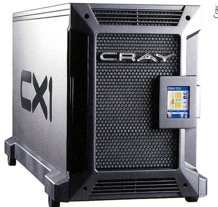
Supercomputing fürs Büro – der Cray CX1.

Transtec besiegelte auf der International Supercomputing Conference ISC in Hamburg eine europäische Partnerschaft mit Cray. Der High-Performance-Computing-Spezialist bringt damit als einziger grosser deutscher Anbieter den globalen