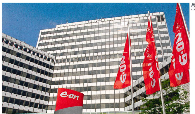
Beendet sein Engagement beim Berner Energieunternehmen: E.On (im Bild Sitz von E.On Ruhrgas in Düsseldorf).