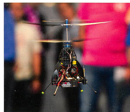
Auch Helikopter wurden in Halle A2 an der Automatica gesichtet.

Mit rund 31000 Besuchern hat die Automatica 2010 der Automatisierungsbranche wichtige Impulse für die wirtschaftliche Entwicklung gegeben. Die Automatica, internationale Fachmesse für Automation und Mechatronik, fand