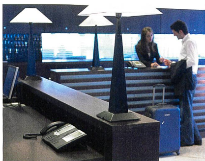
Des systèmes de communication Aastra.

Le groupe Accor, un des plus grands groupes d'hôtellerie au monde, dont les marques comprennent Sofitel, MGallery, Pullman, Mercure, Novotel, Suitehotel, Ibis, All Seasons, Motel 6 et Adagio City Aparthotel, a signé un accord-cadre de trois ans avec Aastra pour la fourniture de systèmes et de services de téléphonie pour ses hôtels dans le monde entier, à l'exception des marques Etap Hotel et Hotel F1. La société Aastra a été choisie pour offrir une plate-forme souple, extensible et économique de services de téléphonie à l'entreprise, qui dispose de plus de 4000 hôtels dans plus de 90 pays. No