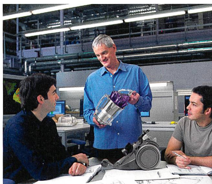
James Dyson bei der Arbeit mit Ingenieuren am Dyson-Hauptsitz in Malmesbury (UK).