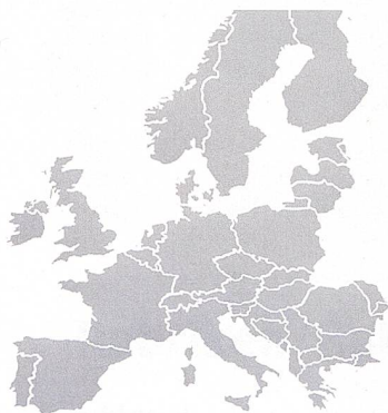
Ausgangssituation: Nationale Märkte