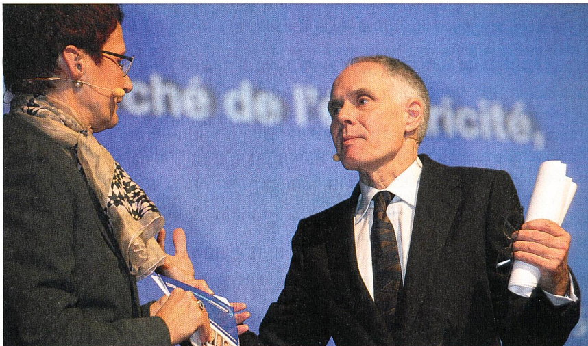
Erklärt sich gestenreich: Bundesrat Moritz Leuenberger. Ses gestions soutiennent ses paroles : le conseiller fédéral Moritz Leuenberger.