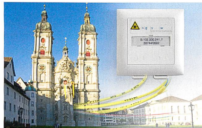
En 2010, la ville de Saint-Gall a mis en service son nouveau réseau de fibres de verre.

Dätwyler Cables, 6460 Altdorf, tél. 041 875 18 26, www.daetwyler-cables.ch