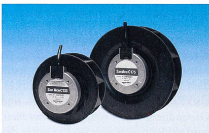
Superflache Zentrifugallüfter erlauben Kühllösungen mit minimaler Bauhöhe.

Telemeter Electronic GmbH, DE-86609 Donauwörth, Tel. +49 906 70 693-0, www.telemeter.info