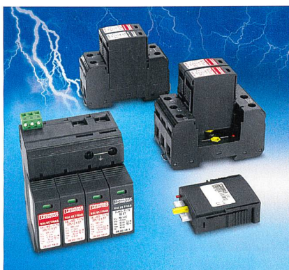
Phoenix Contact lanciert neuen Blitzstromableiter auf Varistorbasis.

Phoenix Contact AG, 8317 Tagelswangen, Tel. 052 354 55 55, www.phoenixcontact.ch