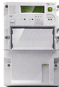
Landis+Gyr Gridstream MDUS wurde bei EKZ implementiert.

Landis+Gyr AG, 6301 Zug, Tel. 041 935 65 00, www.landisgyr.com