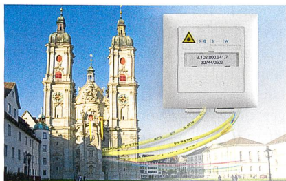
En 2010, la ville de Saint-Gall a mis en service son nouveau réseau de fibres de verre.

Dätwyler Cables, 6460 Altdorf, tél. 041 875 18 26, www.daetwyler-cables.ch