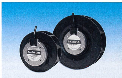
Superflache Zentrifugallüfter erlauben Kühllösungen mit minimaler Bauhöhe.

Telemeter Electronic GmbH, DE-86609 Donauwörth, Tel. +49 906 70 693-0, www.telemeter.info