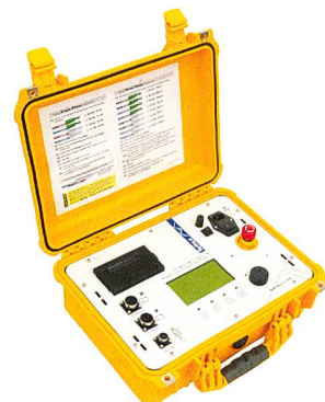
Das Tettex TTR 2796 erreicht eine Genauigkeit von bis zu 0,03%.

Haefely Test AG, 4052 Basel, Tel. 061 373 41 11, www.haefely.com