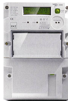
Landis+Gyr Gridstream MDUS wurde bei EKZ implementiert.

Landis+Gyr AG, 6301 Zug, Tel. 041 935 65 00, www.landisgyr.com