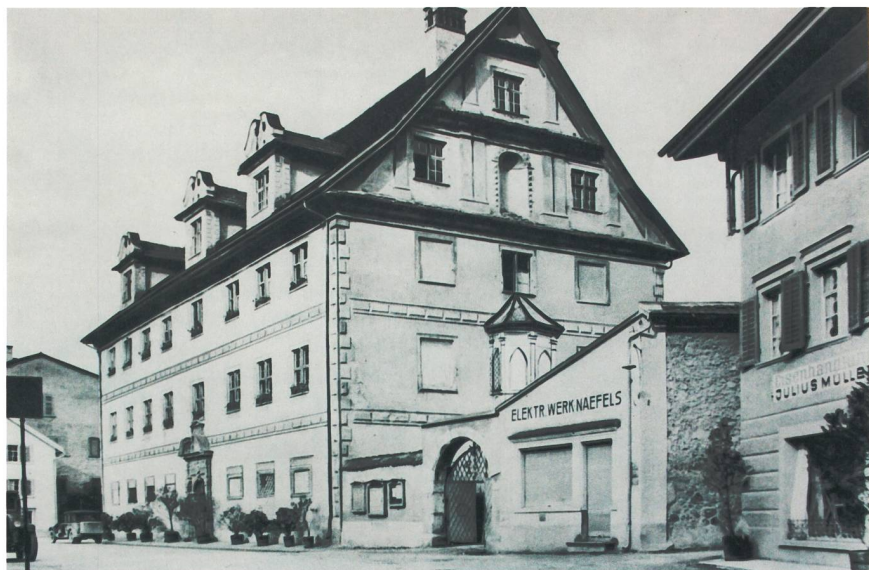
Das erste Kraftwerk eines Elektrizitätswerks im Kanton Glarus wurde 1890 im Freulerpalast in Näfels erstellt. Das Ladengeschäft des Elektrizitätswerks bestand bis in die 1930er-Jahre noch in einem Nebengebäude des Freulerpalastes.

Im Jahre 1901 wurde am Fätschbach in Linthal vom dortigen Elektrizitätswerk ein zweites grösseres Kraftwerk mit einer maximalen Leistung von 1000 PS in Betrieb genommen.