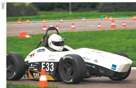
Beschleunigungssieger in Spielberg und 2. in Hockenheim: Novena spielt seine Stärken aus.

Dass die Elektroautos auch auf der Strecke den besten Verbrennern mindestens ebenbürtig sind, demonstrierte das AMZ Racing Team vergangenes Wochenende: Im bewässerten Skidpad gelang dank eines niedrigen Schwerpunkts und guter Fahrwerksabstimmung die schnellste Zeit aller 108 teilnehmenden Teams, beim Acceleration-Rennen (75 m mit stehendem Start) mit 3,74 s und 120 km/h Endgeschwindigkeit die zweit-schnellste Zeit, kein Verbrenner konnte da mithalten.