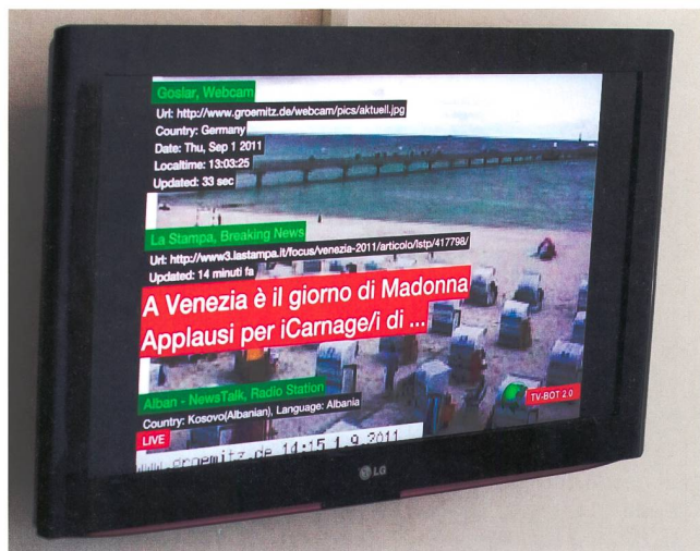
Bild 1 Nur das Neuste vom Neusten: TV-Bot sucht automatisch die aktuellsten Nachrichten aus aller Welt und zeigt sie an.

Wird statt eines inhaltlichen Relevanzkriteriums die «Aktualität» einer Nachricht als Auswahlkriterium gewählt, kommt es zur Informationsüberflutung. Diesem Thema ist die Arbeit von Marc Lee (Bild 1) gewidmet. Ein Grossmonitor zeigt stets die neusten online verfügbaren Meldungen an, mit Webcam-Bildern untermalt. Man springt von Kontinent zu Kontinent fast schon im Sekundentakt –