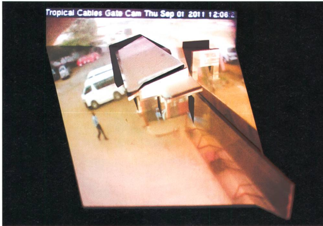
Bild 2 Die Projektion einer Überwachungs-Webcam bei einem Werkstor in Ghana ist einer der vier Live-Streams des Objekts von Markus Kison.

und lernt die Arbeit von Redaktionen schätzen, die fähig sind, Ordnung ins Chaos zu bringen.