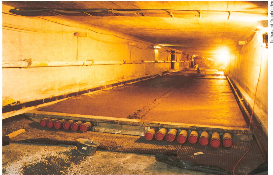
Bild 2 Kabelschutzrohre nach dem Betonieren.

Die von der Firma Brugg Kabel AG zusammen mit der Firma Kummler & Matter durchgeführten Berechnungen zum Kabeleinzug in die bestehende Rohranlage ergaben, dass auch Kabellängen von ca. 2500 m eingezogen werden können. Dabei besteht der grosse Vorteil darin, dass anstelle von fünf Muffengruppen für zwei serielle Crossbonding-Systeme nur noch zwei Muffengruppen be-